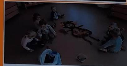
Is turimos gamtinės medžiagos sukūrėme linksmą veikėją.