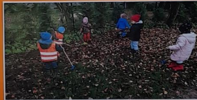
Lauke galima rasti labai daug gražių ryškiaspalvių lapų. Vaikai surinko įvairiaspalvę puokštę, grupėje sudžiovino ir panaudojo įvairiems darbeliams. Vėliau sutvarkė savo aikštelę.