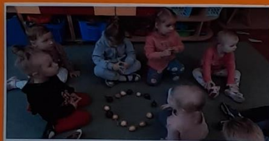
Grupelėmis dėliojo dėlionę iš svogūnų, kalbėjo apie jų spalvą, naudą žmogui, dydį, formą.

Parengė: Renata Pavlovič ir Irena Jankauskienė