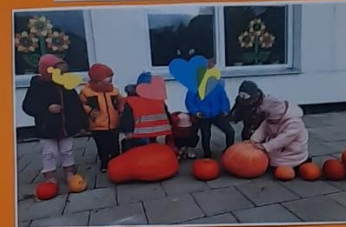
„Moliūgų gatvė“ mūsų darželio teritorijoje. Spalvingi moliūgai pasitarnavo ne tik kaip auksinio rudens aksesuaras, bet ir kaip gamtos pažinimo priemonė. Žaisdami vaikai lygino, pastebėjo panašumus ir skirtumus, pavadino savybes, dydį, spalvą ir pan. Be to, tokia aplinka skatino vaikus žaisti, bendrauti, judėti ir taip stiprinti sveikatą.