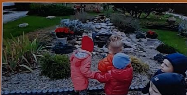
Vaikai domėjosi artimiausia gamtine aplinka, jos spalvomis ir grožiu.

TIKSLAS – kurti edukacines erdves lopšelio-darželio aplinkoje, kūrybiškai naudojant jas tyrinėjimams, pasaulio pažinimui, vaiko asmens ir dalykinės kompetencijoms ugdyti.