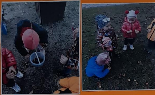
Domėjosi, kaip atrodo kaštonų lapai ir vaisiai. Atliko įvairias linksmas užduotis su kaštonais: skaičiavo, dėliojo pagal dydį, lupė juos ir rinko į kibirėlius.